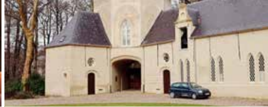
Wist u dat ... (p.3)