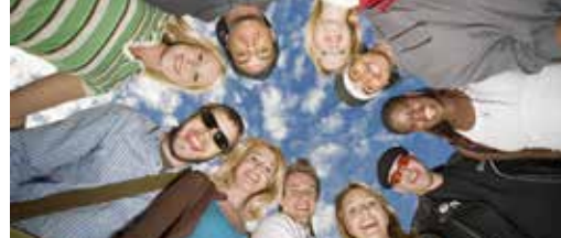
Gezocht: schalkse jongeren met frisse ideeën! p3