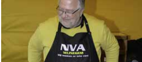
Onze burgemeester bakt ze knapperig en bruin. p2